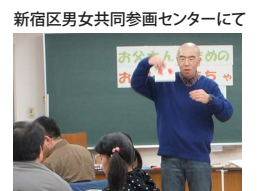
新宿区男女共同参画センターにて