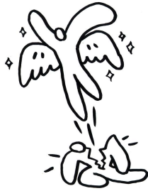
「アウェー脳を磨け」より

独立後は書籍雑誌新聞などに挿絵や表紙を描く。手描き水彩画タッチのほかマンガタッチ、切り絵、立体オブジェなども得意とする。